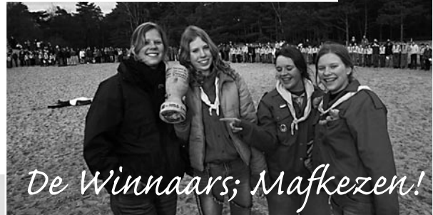
De Winnaars; Mafkezen!