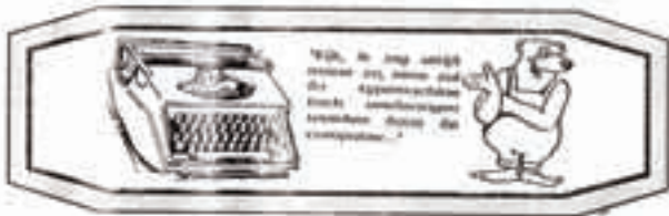
uit de krant van 1991

Wat was jij toen? Wat is jouw functie nu?